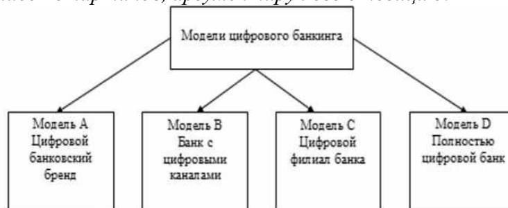
Рисунок 1. Модели цифрового банкинга